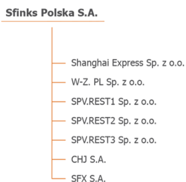
Tab. Struktura Grupy Kapitałowej.

Na dzień 30 września 2021 r., na dzień 30 września 2020 r. i na datę sporządzenia niniejszego sprawozdania w skład Grupy Kapitałowej Sfinks Polska wchodziły następujące spółki zależne powiązane kapitałowo: